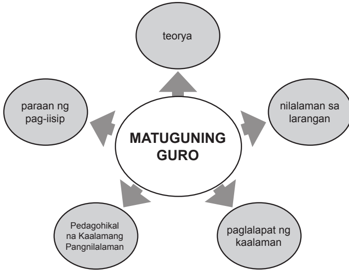
Figura 2. Balangkas ng Nilalaman sa Espesyalisasyon o Larangan ng OBTEC-PNU

Sa OBTEC-Filipino, magiging kongkreto ang iba't ibang inobatibong gawain upang maging ganap itong daluyan at lunsaran ng makabayang pedagohiya. Ang mithiing makabayang pedagohiya batay sa talaban ng nilalaman at pamamaraan ay nakaugat sa pang-institusyong hangarin na makalinang ng ganap at totoong edukadong mag-aaral. Sangkap nito ang kakayahang pangkaisipan, kakayahang pangkasanayan, at pananagutang panlipunan upang mapahusay ang kaalaman at kasanayan sa komunikasyon, teknolohiya, pangangatwiran, at paglutas ng iba't ibang suliranin. Gamit ang 4K: kamalayan, kaakuhan, kasaysayan, at kalinangan sa ugnayang pedagohikal, tinitiyak ng OBTEC-Filipino na ito ay magiging lunsaran ng pagpapatibay at pagpapalakas ng diwang makabayan na panghabambuhay na magtatampok, magsusulong, magtataguyod, magtatanghal ng kaakuhan, kamalayan, kalinangan, at kasaysayan ng lipunang Pilipino.